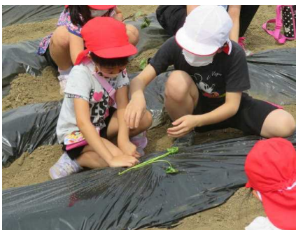
【1・6年生 サツマイモ植え】

どの活動も生き生きと頑張っている子どもの姿が見られます。地域の皆様に支えられています。