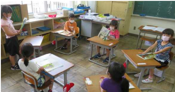
【1年生 グループで音読をしたり、聞いたりしています】